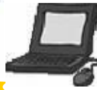
パソコンなどの精密機械