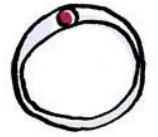
ダイヤモンドの アクセサリ

「紛争ダイヤモンド」、「紛争タンタル」という言葉を耳にしたことが ありますか？「紛争ダイヤモンド」「紛争タンタル」とは、武装勢力 の支配下で産出され、軍事活動の資金源として利用されるダイヤモンド やタンタルの事をいいます。